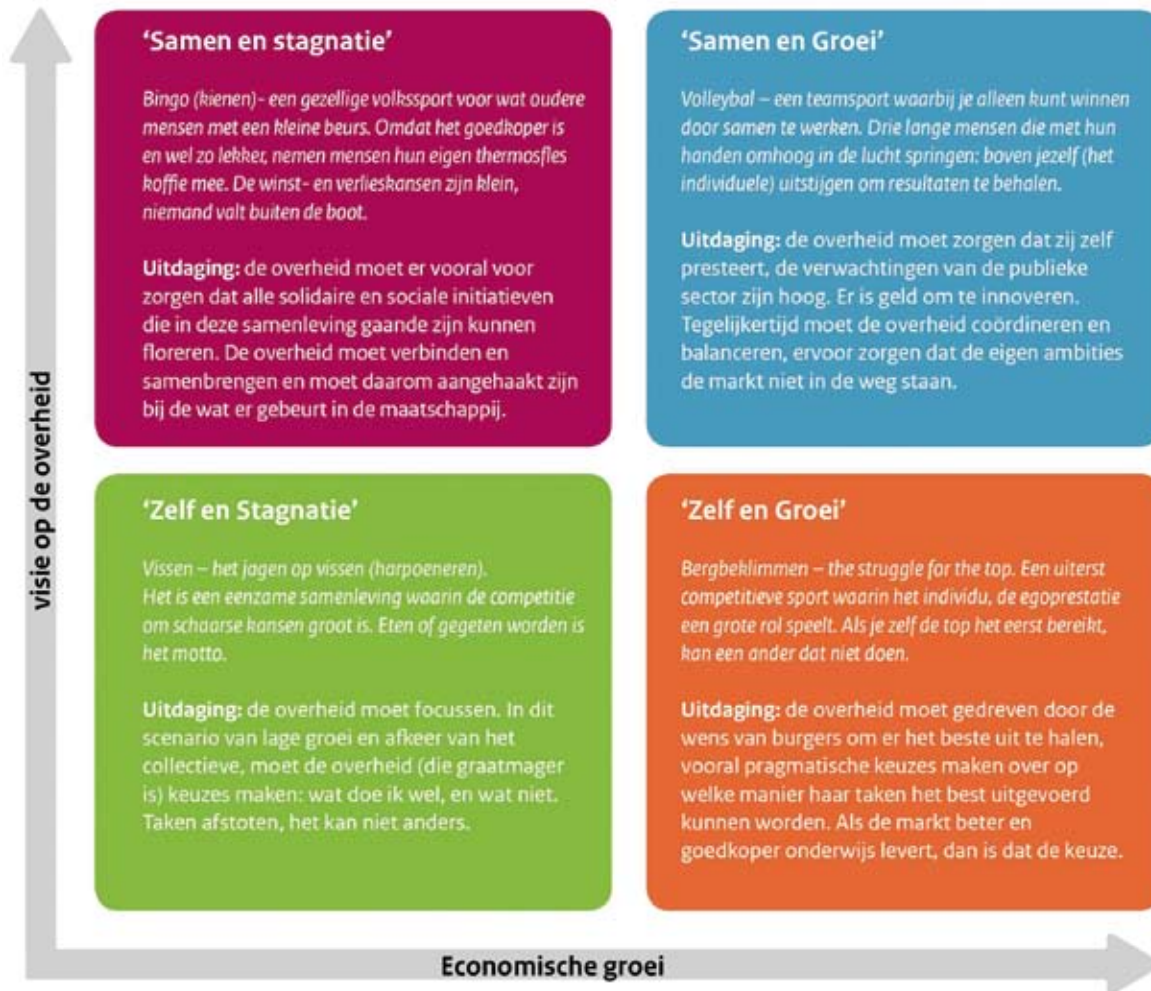
Figuur 2. De vier scenario's

De SCO verenigt alle werknemers van de overheid en onderhandelt over centrale arbeidsvoorwaarden. Het SCO is dus in feite een 'vereniging van verenigingen' die overlegt met een andere 'vereniging van verenigingen': het VSO.