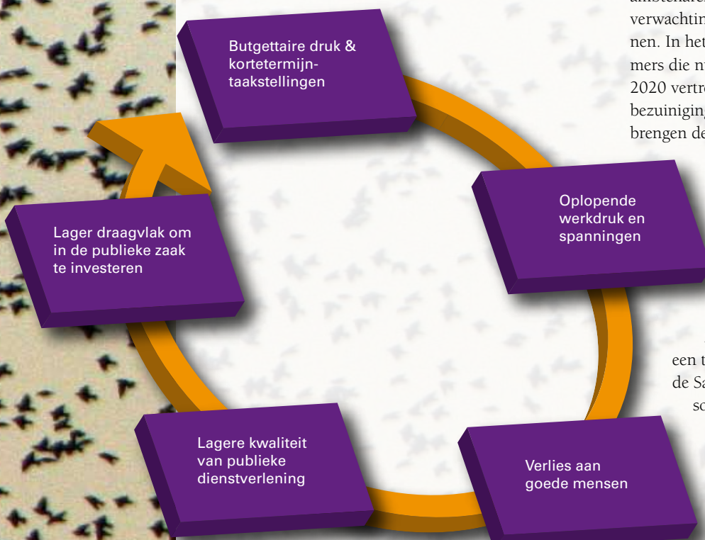
Figuur 1. Negatieve spiraal

Met deze kennis in het achterhoofd zette het Ministerie van Binnenlandse Zaken en Koninkrijksrelaties (BZK) in 2009 een toekomstverkenning op touw met als partners de Samenwerkende Centrales van Overheidspersoneel (SCO) en het Verbond Sectorwerkgevers Overheid (VSO). Dit project, Arbeidsmarkt en Publieke Taken, werd medio april jl. afgesloten met een rapport. Deze toekomstverkenning van de arbeidsmarkt van het publieke domein is een mooi voorbeeld van de rol die verenigingen (kunnen) spelen in de publieke sector. Ook op de arbeidsmarkt